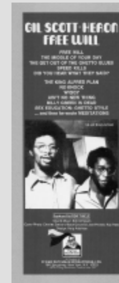
Pub. pour le disque Free Will avec G.S.H et Brian Jackson