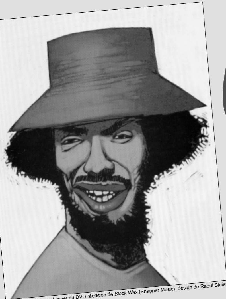
Dessin / cover du DVD réédition de Black Wax (Snapper Music), design de Raoul Sinier