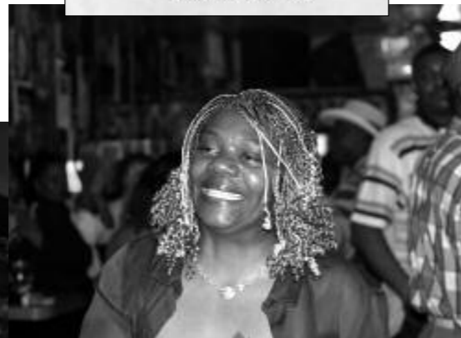
Ci-DESSUS DE HT EN BAS : affiche pub du Linda's / Lady Cat au Linda's - 6/6/05