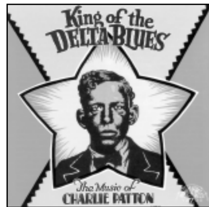
CI-CONTRE, "Patton" dessin de Crumb pour le cover Yazoo Records "King of the Delta Blues", 1991.

(Penguin Books, New York, 1981) dont les anecdotes seront en fait très largement remises en cause quelques années plus tard dans l'ouvrage de Stephen Calt "King of the Delta Blues : The Life and Music of Charley Patton" (Rock Chapel Press, 1988). Mais peu importe, à travers cette histoire de Patton, c'est tout le romanesque du vieux blues campagnard qui est dépeint et qui exerce encore aujourd'hui une sorte de fascination (musique du Diable, histoire et signification mystique du crossroad, etc...). Patton y est présenté comme un personnage paresseux, buveur, bagarreur, vivant aux crochets des femmes et jouant de la musique avant tout pour faire danser. Cette fresque montre aussi les studios d'enregistrement temporaires improvisés dans des chambres d'hôtel, les compagnies discographiques qui enregistraient les chanteurs de blues locaux dans l'espoir de vendre des phonographes aux noirs. On y voit Willie Brown, Son House et Patton qui, dédaignant initialement la musique de Robert Johnson, poussent l'adolescent à quitter sa région. La santé déclinante de Patton, sa vie avec Bertha Lee dans les années 30, leurs bagarres, leur dernière séance d'enregistrement en 1934 où ils interprètent Oh Death et où Patton se sent proche de la fin, sont formidablement traitées.