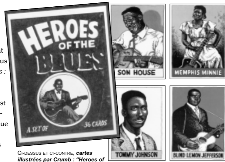
CI-DESSUS ET CI-CONTRE, cartes illustrées par Crumb : "Heroes of the Blues", Ed. Yazoo Records, 1980.

Dans Jelly Roll Morton's Woodoo Curse (5), Crumb élabore un scénario basé sur la folie de Morton à travers les forces mystérieuses du vaudou. On assiste à un de ses cauchemars terrifiants montrant l'incarnation de la mort tentant de l'emmener en enfer. Ici, Crumb s'est inspiré de l'exceptionnelle interview de Morton objet du livre de Alan Lomax "Mister Jelly Roll" (parution originale en 1950 – traduction Ed. Presses Universitaires de Grenoble, 1980). L'ambiance tout à fait particulière de ces deux histoires provient aussi de la technique du dessin, elles ont été réalisées par Crumb à l'époque où il travaillait au pinceau dans le style noir des BD policières du début des années 50. Dans le même registre, ses portraits des musiciens traditionnels, et notamment les pionniers et légendes du blues de l'entre-deux-guerres, sont marquants par leur côté très solennel voire très "posé". On retrouve d'ailleurs ce réalisme caricatural dans nombre des covers qu'il a réalisés pour Yazoo Records (Patton, Memphis Jug Band, Casey Bill