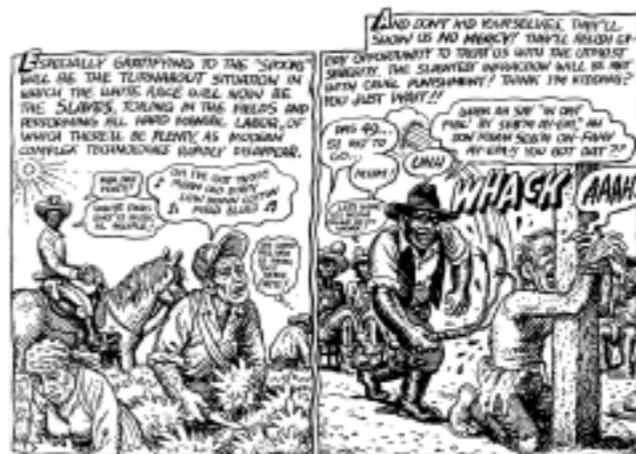
CI-DESSUS, extrait de "When the Niggers take over America" qui est un commentaire violent sur les Etats-Unis ; fiction où Crumb inverse les rôles : les blancs sont les esclaves des noirs. Tiré de Weirdo , n° 28, 1993.