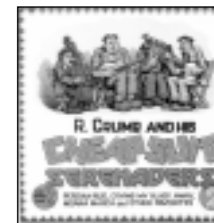
CI-DESSUS, illustration de l'art graphique de Crumb : livres et covers.