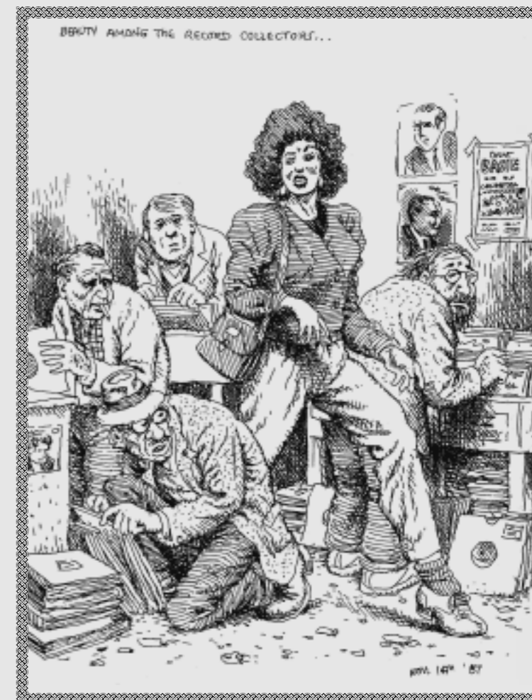
CI-DESSUS, “Beauty among the record collectors”, dessin de Crumb de 1987 que l’on peut retrouver dans “Mister Nostalgia.”